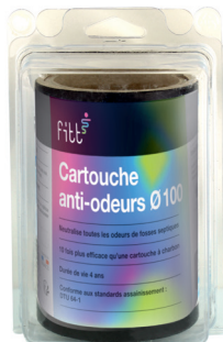
Produit sous blister brochable