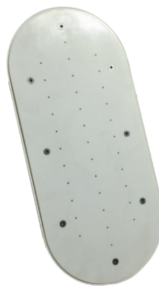
Kit balnéo EFFERVESCENCE SOLO