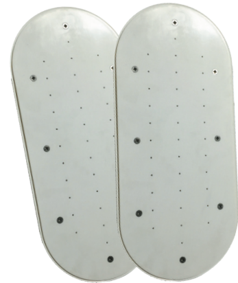
Kit balnéo EFFERVESCENCE DUO