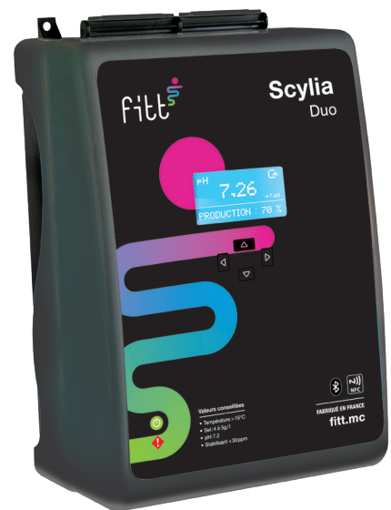
Électrolyseur SCYLIA Duo