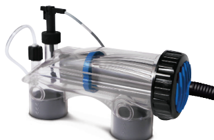
Dispositif d'injection du pH intégré à la cellule avec système "anti-pincement"