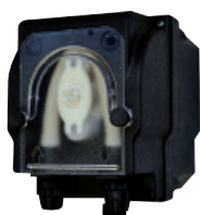
Pompe péristaltique externe 3 litres/h