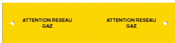
Plaques de protection pour les réseaux de gaz. Référence SPP250J