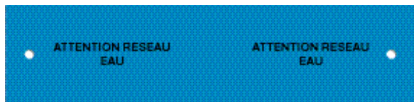
Plaques de protection pour les réseaux d'eau. Référence SPP250B