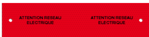
Plaques de protection pour les réseaux électriques. Référence SPP250R