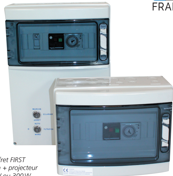
Coffret FIRST Filtration + projecteur 100W ou 300W