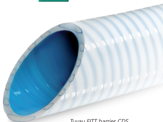
Tuyau FITT barrier CDS