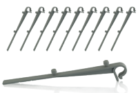
10 pattes de fixation gris clair