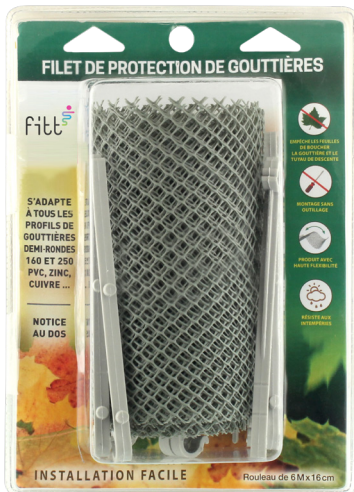
Filet de protection de gouttières (blister avec notice au dos)