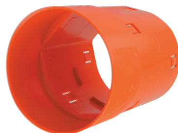
Manchon PVC Pour drain rigide enrobé cr4/sn4