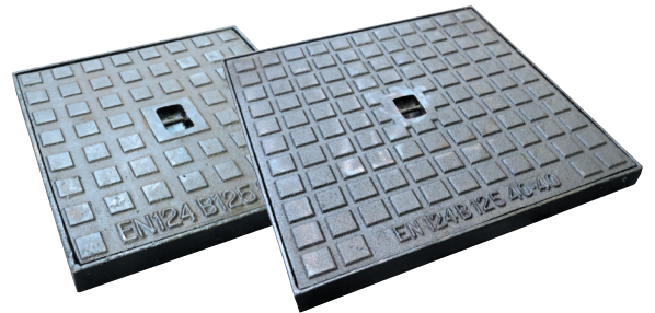
Regards hydrauliques 300x300mm et 400x400mm.

Classification B125 (EN 1433), normalisation EN 124.