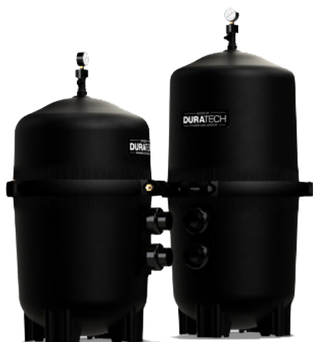
Filtres à cartouches Flow 39 et Flow 49