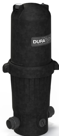
Filtres mono cartouche SDFC019