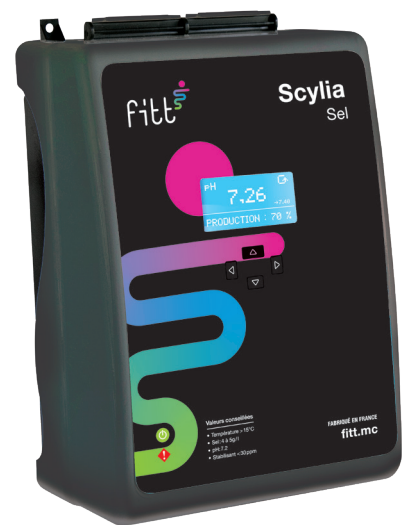
Électrolyseur SCYLIA Sel