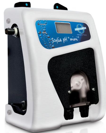
Électrolyseur SCYLIA MINI