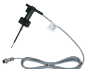
Capteur de débit