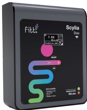
Électrolyseur SCYLIA DUO NG (Nouvelle Génération)