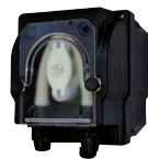
Pompe péristaltique externe 3 litres/h