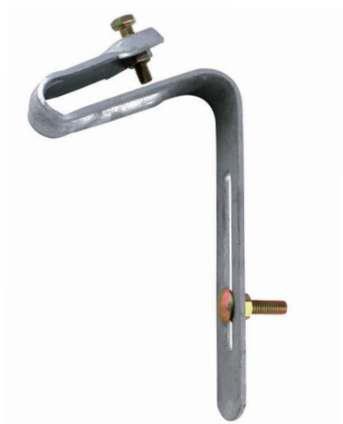
Étrier galvanisé Ø6 x 25 mm livré avec toute la visserie montée