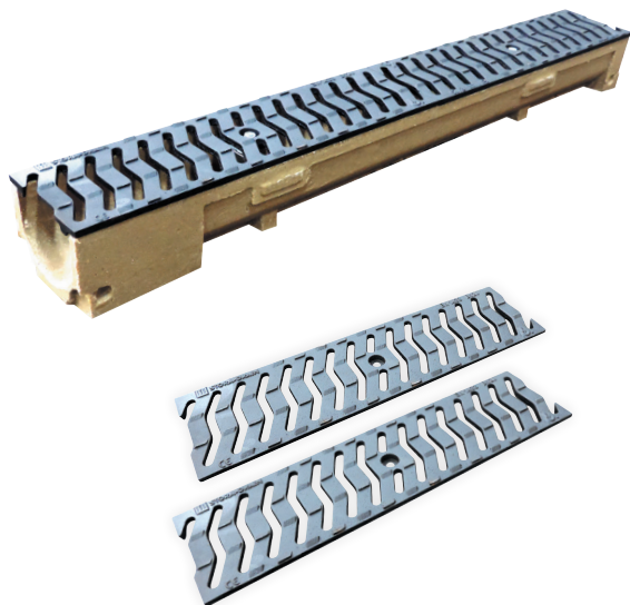
Caniveau livré avec 2 grilles passerelle résistance B125