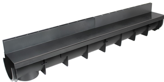
Caniveau avec couvercles à fente L 1M x 130mm X 110mm