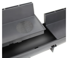
Couvercles à fente avec système d'emboîtement à clips