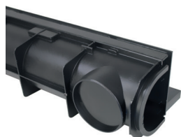
Sortie Ø 100 préformée à découper pour le raccordement au réseau d'évacuation