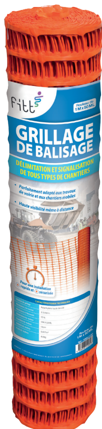
Rouleau de 50 ML