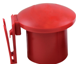
Embout équipé d'une pince à clip pour fixer le grillage