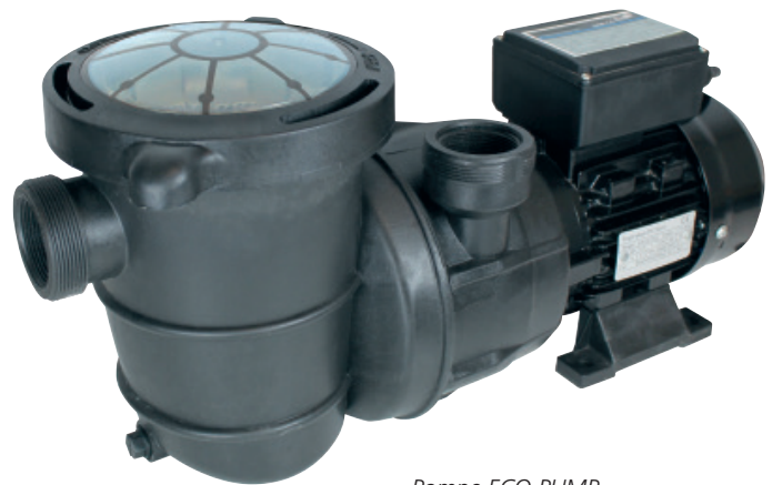
Pompe ECO PUMP