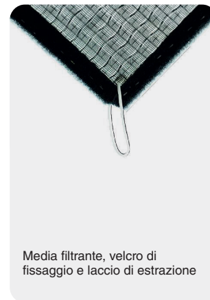
Media filtrante, velcro di fissaggio e laccio di estrazione