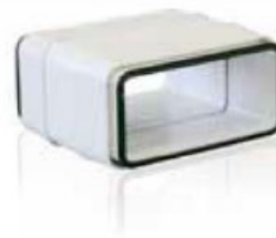
VM0510ES VMT-P1020ES VMSU2020ES